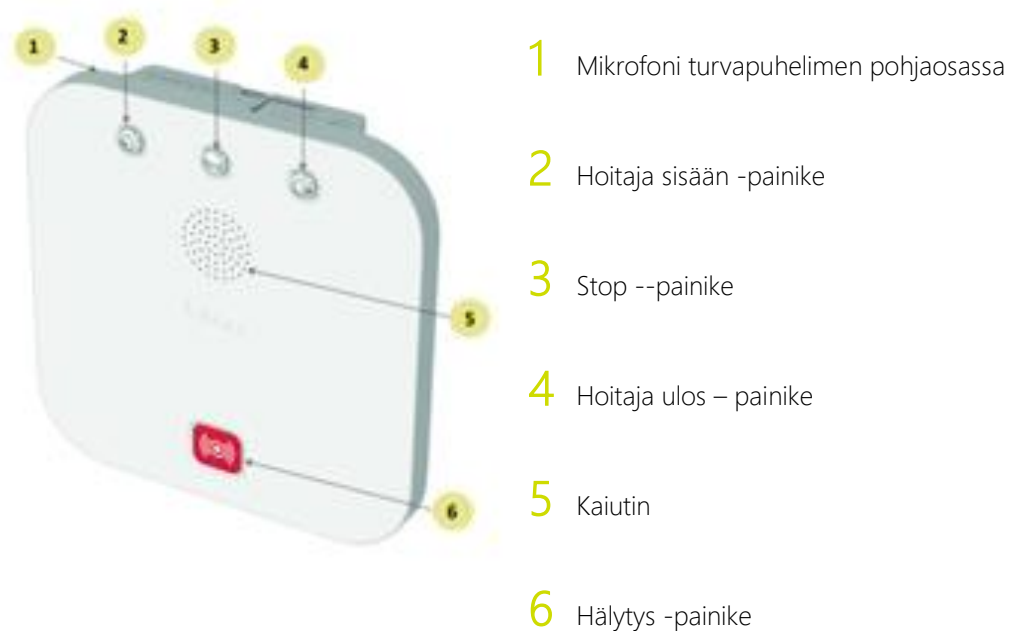
Kuva 3. Domi POINT -turvpuhelin