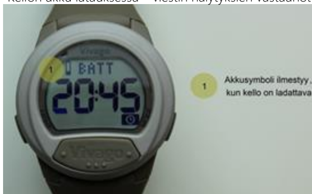
Kuva 6. Vivago CARE -kello ilmoittaa lataustarpeesta akkusymbolilla

Kun laturi on kiinnitetty oikein, kellon näytössä näkyy latauksen etenemistä esittävä animaatio merkinä siitä, että kellon akku latautuu. Kello lähettää myös Domi POINT -turvpuhelimien kautta "Kellon akku latauksessa" -viestin hälytyksien vastaanottajalle.