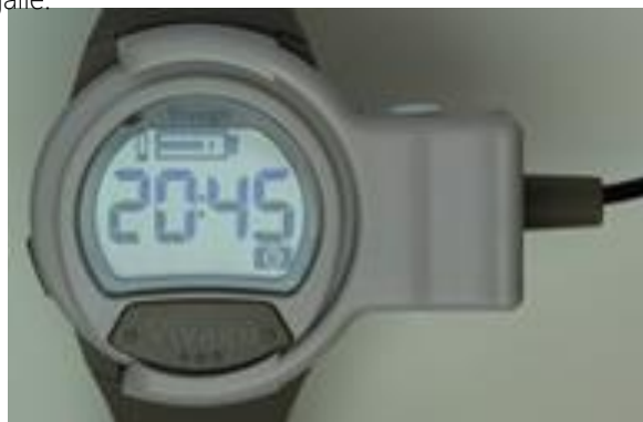
Kuva 7. Vivago CARE -kello latauksessa