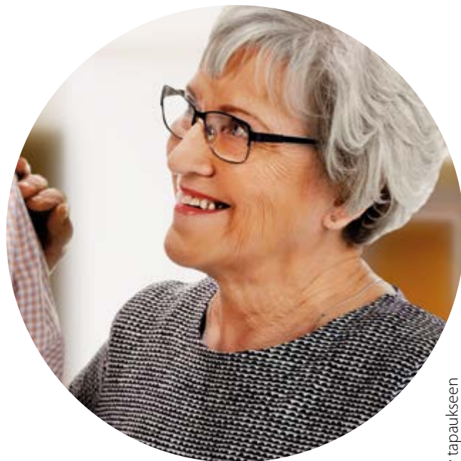
Kuvan henkilö ei liity tapaukseen

Alhaisen verensokerin aiheuttama tajuttomuustila