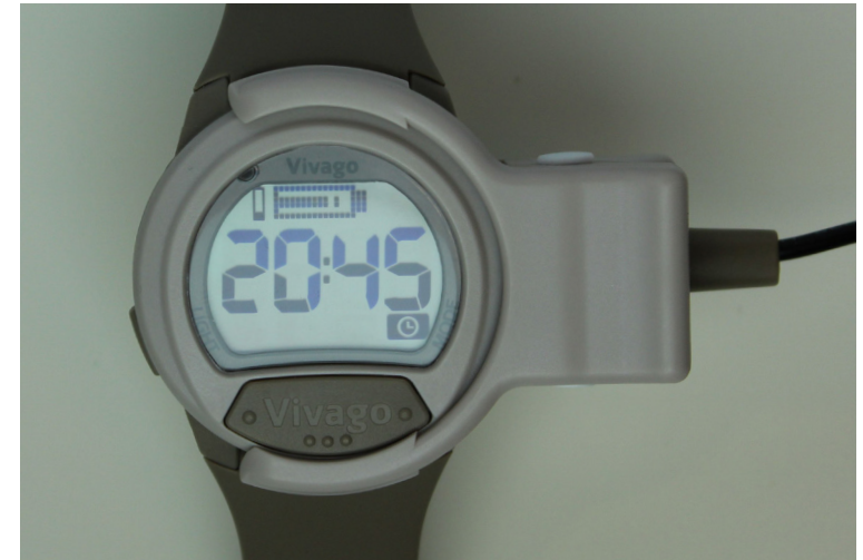
Kuva 5b. Vivago-kello latauksessa

1 Akkusymboli ilmestyy, kun kello on ladattava