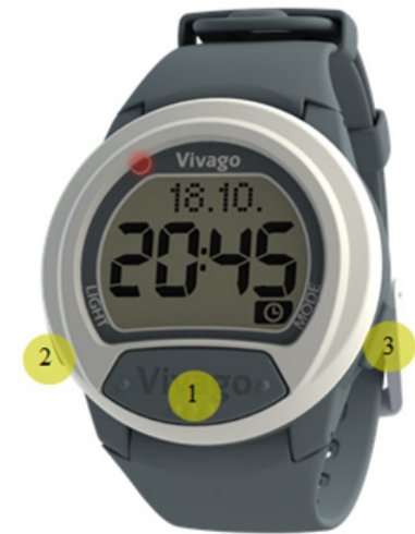
Kuva 1b. Vivago-kello ja painikkeet

3 MODE-painikkeella voit selata kellon eri näyttöjä.