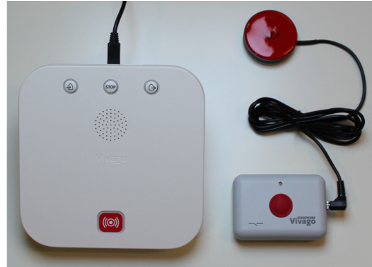
Kuva 4a. Domi POINT -turvpuhelin, laiteliitin ja hipaisukytkin

Domi POINT -turvpuhelimeen voidaan liittää laiteliittimen avulla lisälaitteeksi hälyttimeä, ovivahti tai toisen Vivago-kellon käyttäjän hoidollisen ajan seuranta. Liitteessä 2. on lueteltu Vivago DOMI -ratkaisun lisälaitteet.