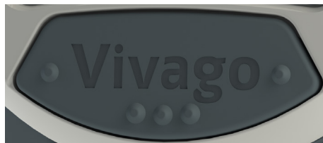
Kuva 1a. Vivago-painike.

Voit tehdä hälytyksen Vivago-kellolla, vaikka kello ei ole ranteessa. Hälytyksen voi tehdä myös Vivago Domi POINT -turvapuhelimen Hälytys-painikkeesta, katso kuva 2.