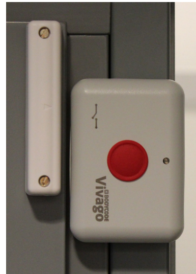
Kuva 4b. Laiteliitin ovivalvontaan